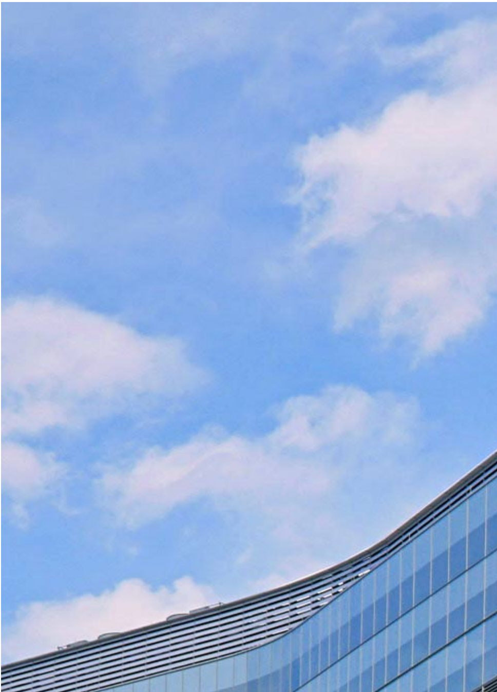
immeuble hôpital - Image master DSPP hôpital