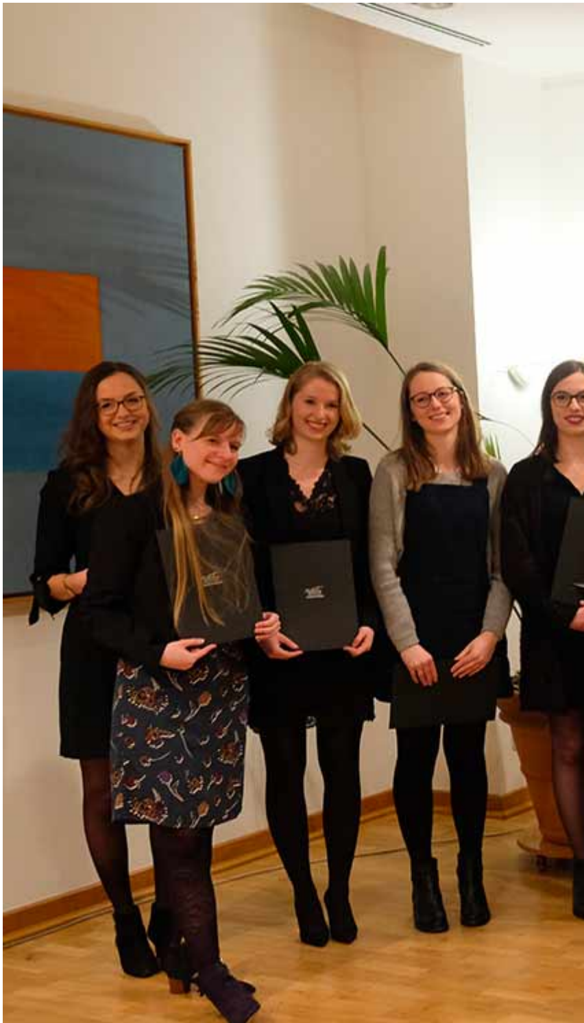
photo de la CRD du master intégré franco-allemande HHU Düsseldorf • 28/09/2018 : Cérémonie de remise de diplômes de la 11ème promotion de la filière intégrée franco-allemande à CY Cergy Paris Université