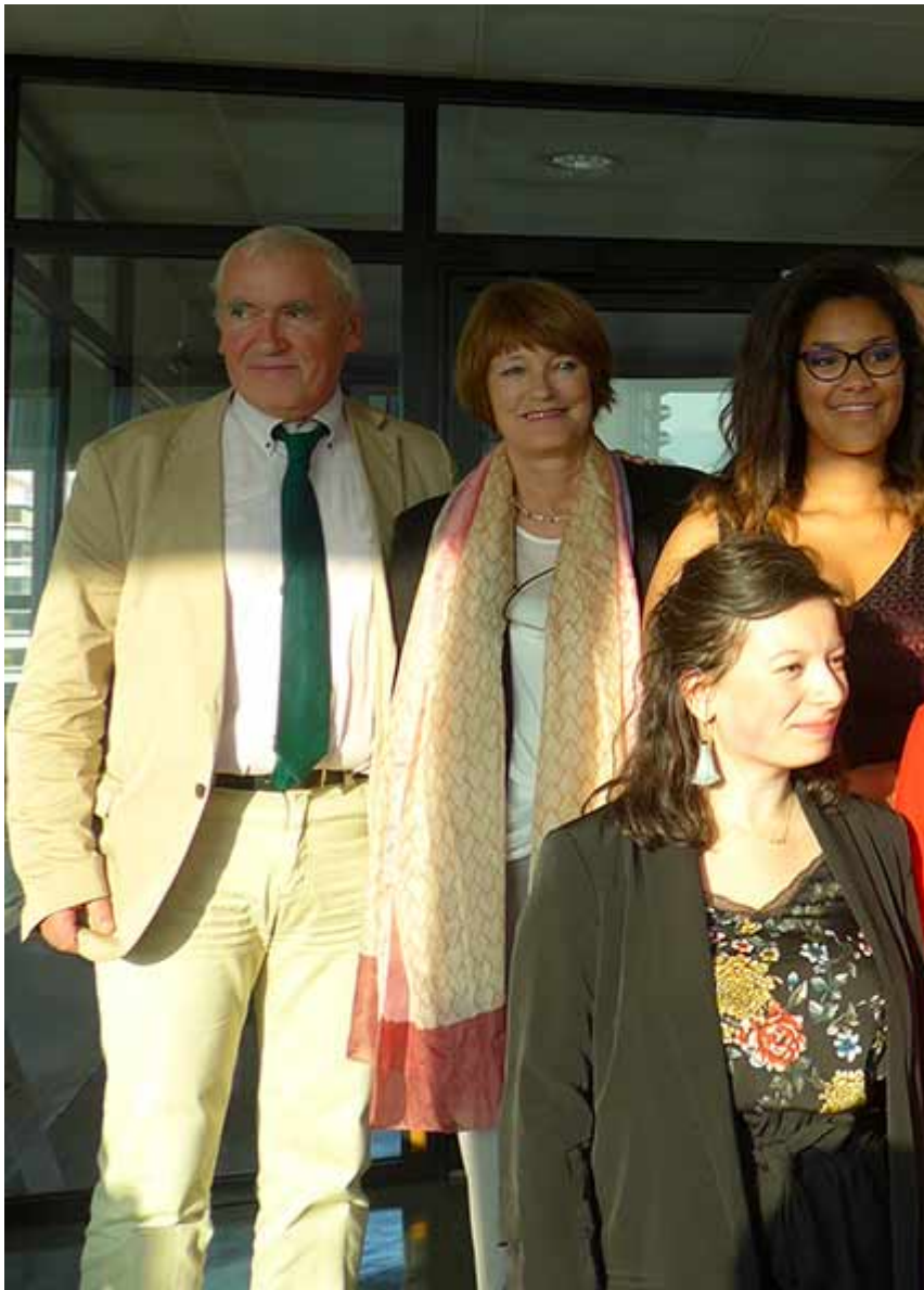
photographie de la 11ème promotion de la filière franco-allemande de la faculté de droit CY