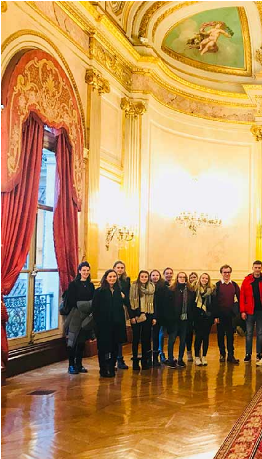
photographie de la visite de l'assemblée nationale de la Licence-intégrée franco-allemande de la Faculté de droit CY • 02/02/2019 : Cérémonie de remise de diplômes du Master intégré franco-allemand à la Heinrich-Heine-Universität Düsseldorf