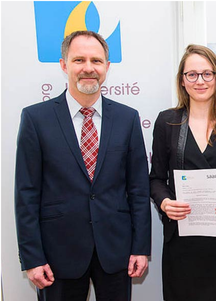
photographie de la bourses SaarLB