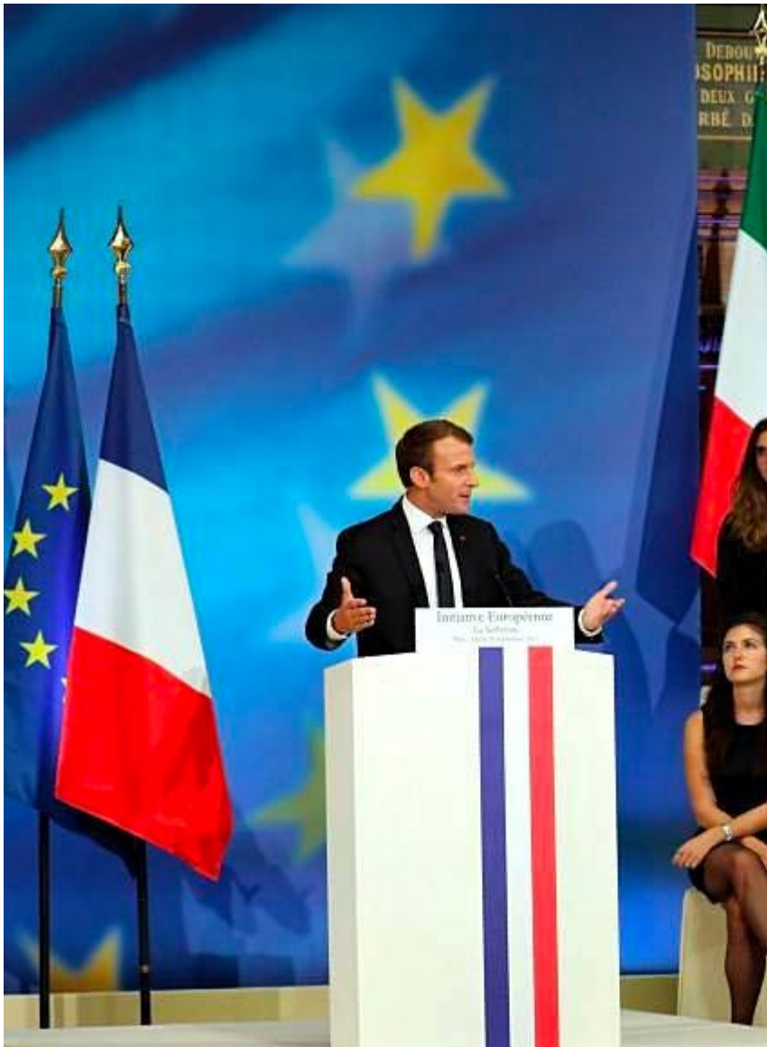
photographie du discours de Macron à la Sorbonne sur l'Europe